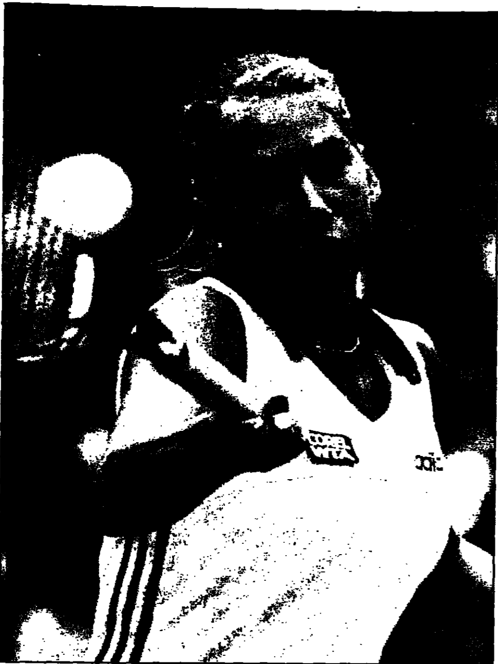
الروسية أندر أكيوفا